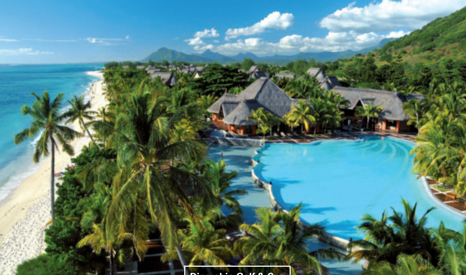
Dinarobin Golf & Spa