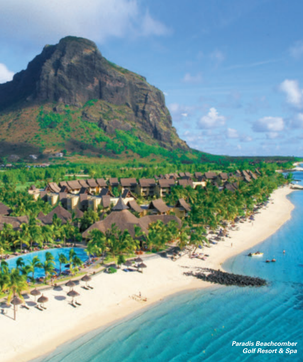
Paradis Beachcomber Golf Resort & Spa

Pro Person im Doppelzimmer Deluxe inklusive Halbpension und aller o.g. Leistungen ab ca. € 1.810,- Fragen & Buchungen: Reiseservice Africa, +49 (0) 89 811 90 15, kontakt@reiseservice-africa.de www.reiseservice-africa.de