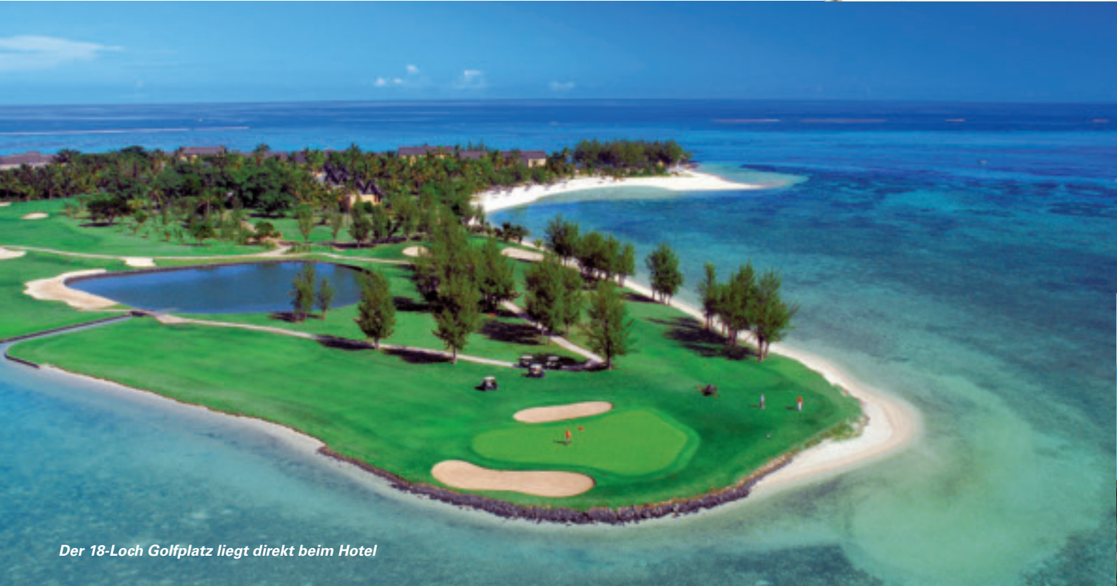
Der 18-Loch Golfplatz liegt direkt beim Hotel